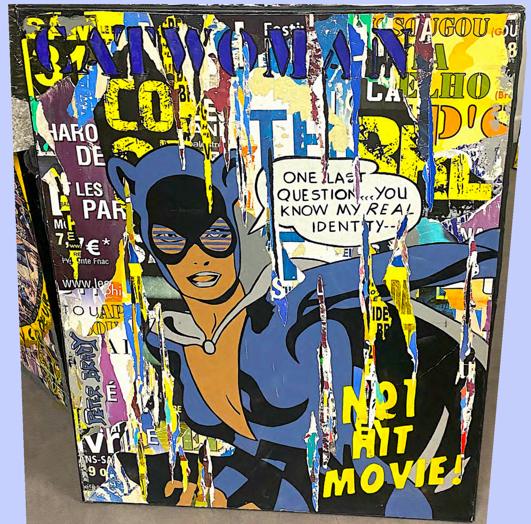
▶ Cat Woman - techniques mixtes 93 x 72