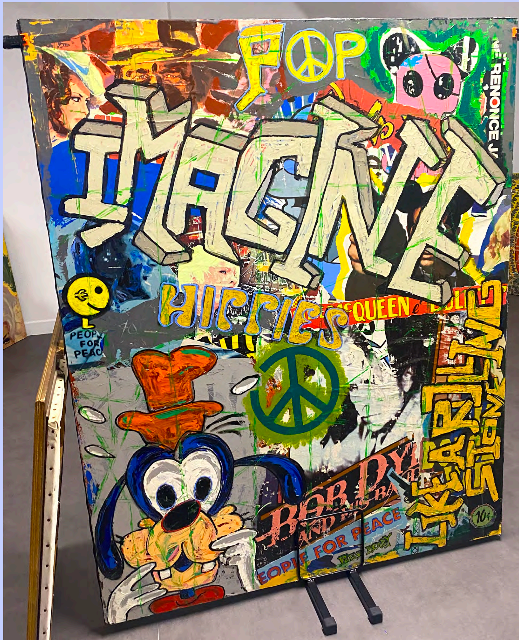
▶ Imagine - techniques mixtes 162 x 130