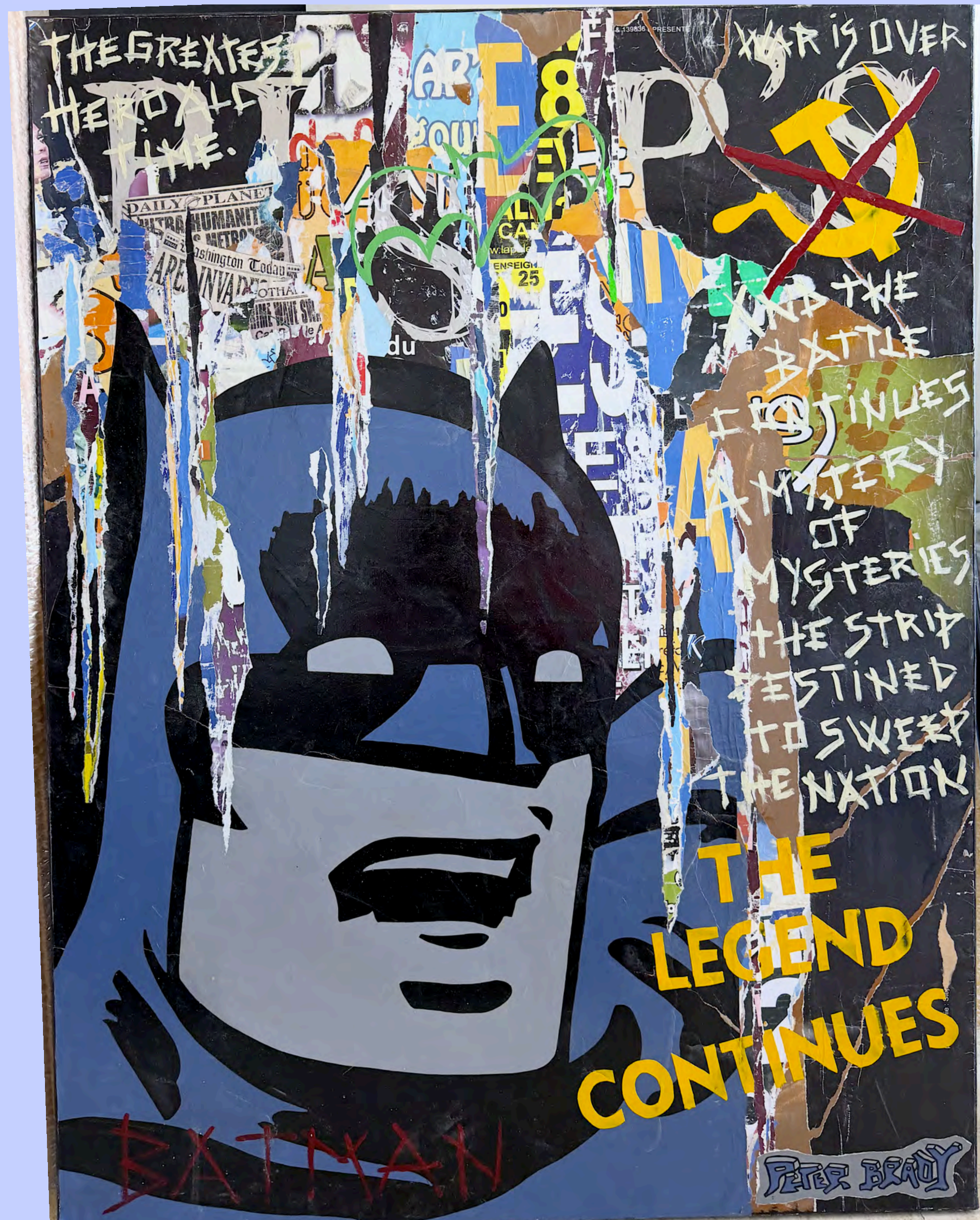
▶ Batman - techniques mixtes 116 x 90