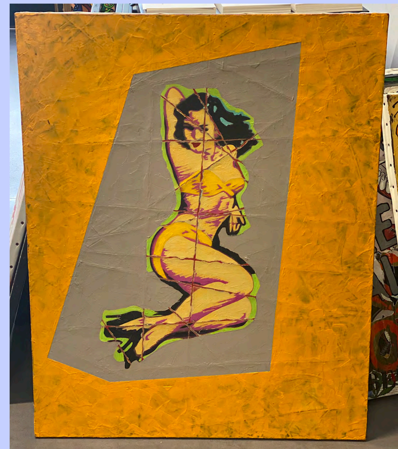
▶ Pin-Up - techniques mixtes 93 x 72